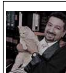
Av. Ahmet Kemal ŞENPOLAT

Tekrar hayvanları koruma yasasının değiştirilmesi için farkındalık çalışmalarımız başta olmak üzere, hukuki mücadelemiz, toplumu aydınlatma rahatsız edici cümleleri kullanma hakkımızın HAYTAP Hayvan Hakları Federasyonu olarak yeniden ve yine başladığını söyleyebilirim.